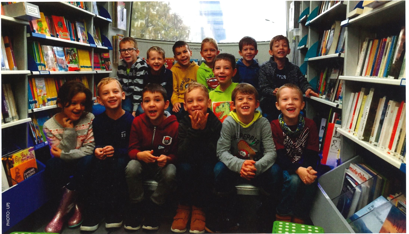
Quatre cent vingt-trois écoliers ont visité le Bibliobus en 2018, comme ici, à Orvin.