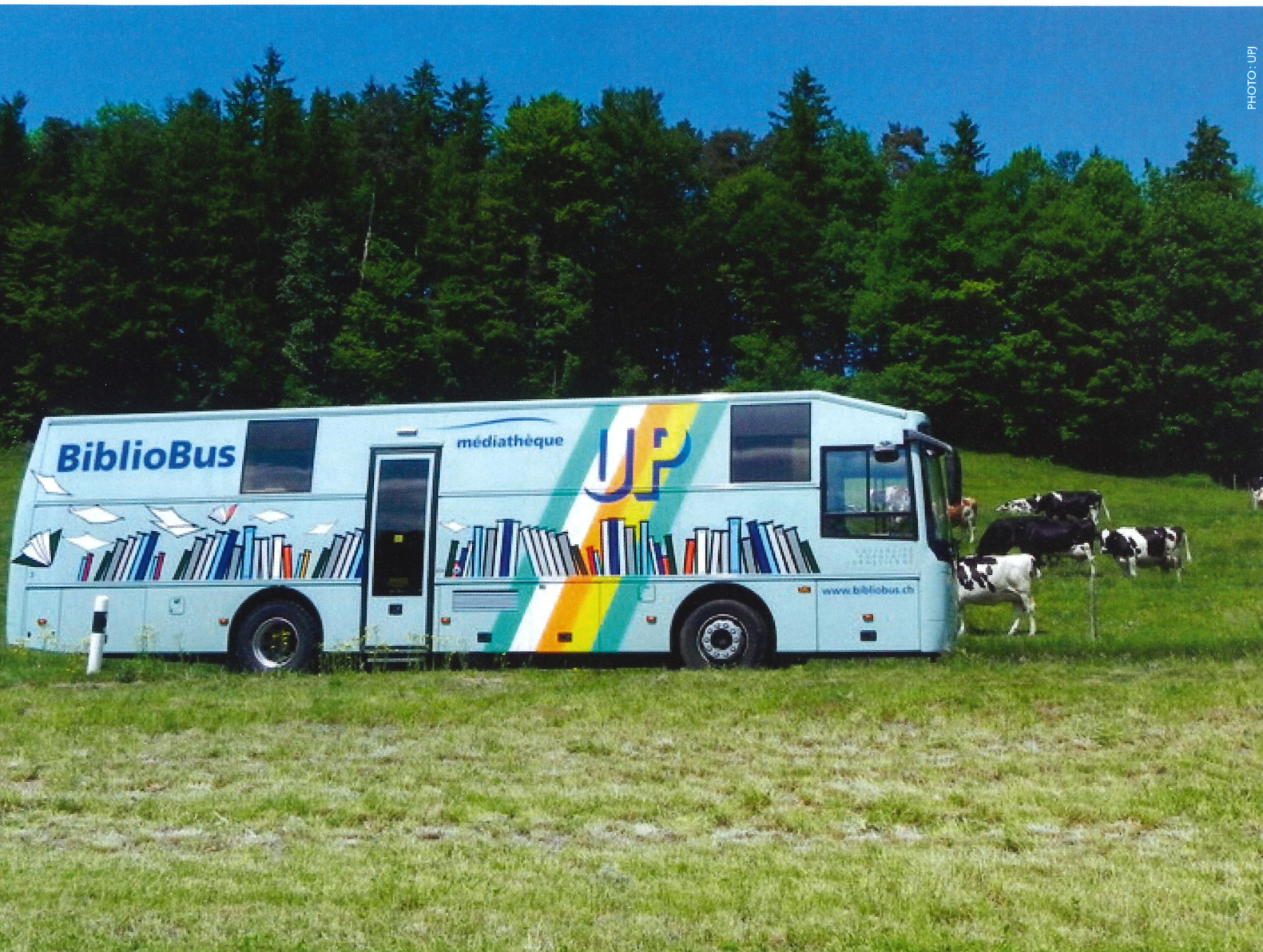
Le BiblioBus apporte la culture dans les coins les plus reculés du Jura.