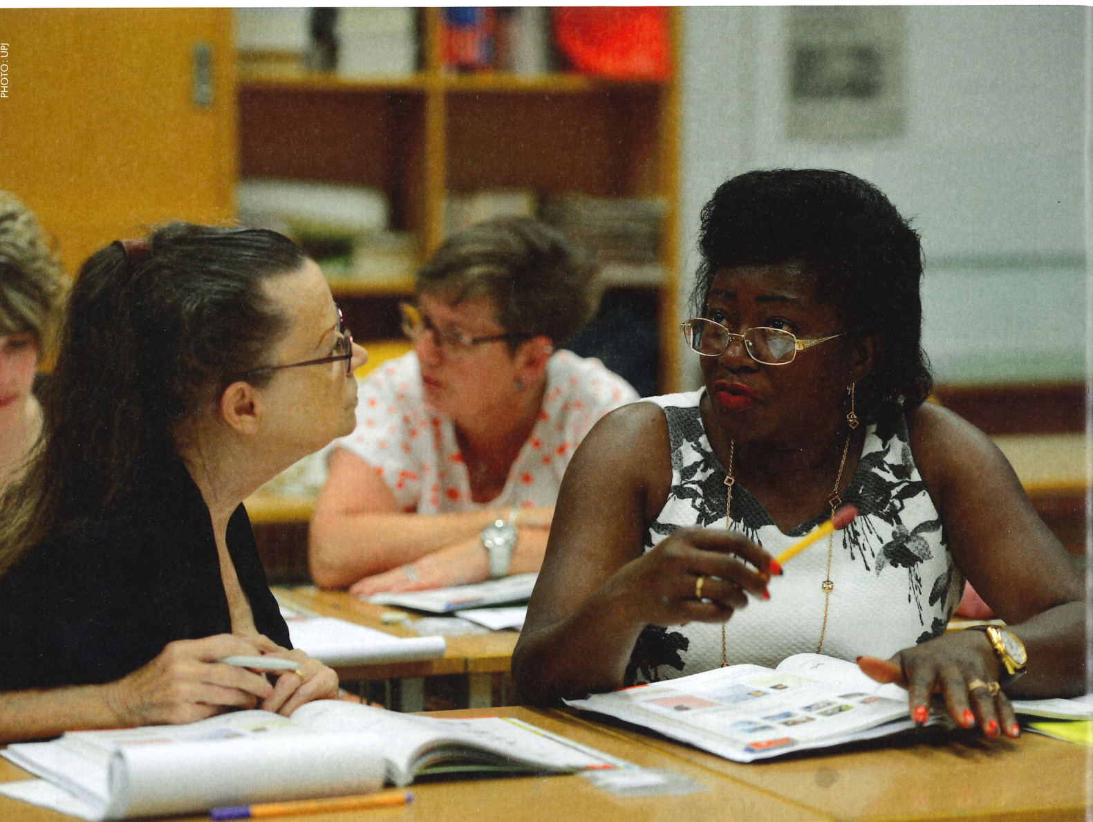
Les cours de langues on fait le succès de l'Université populaire jurassienne.